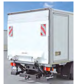
... mit abschließender LBW.