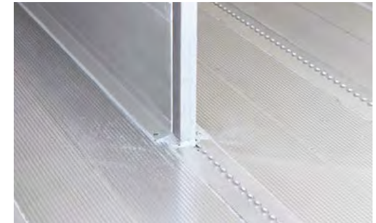
Bodenvariante Aluminium-Leiselaufboden. Eingelassene Zurrschienen und umlaufende Verschweißung mit der Scheuerleiste möglich.