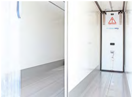
Längstrennwand. Für eine optimale Laderaumaufteilung fest verbaut.