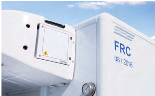
Serienmäßige Ausstattung des ATHLET Thermo-Aufbaus mit dem AEROFORM-Profil. Unterschiedliche Kühlmaschinen sind erhältlich.