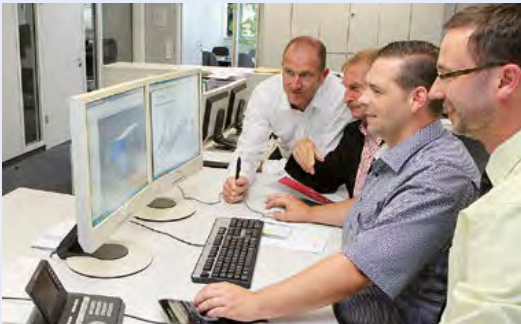
Gemeinsam mit unseren Kunden betreiben wir individuelle Produktentwicklungen – so entsteht höchste Kundenzufriedenheit.