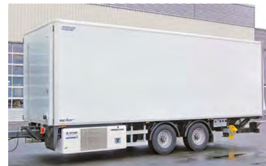
Zentralachsanhänger mit Kühllaufbau.