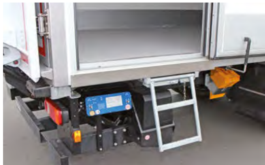
2-stufiger herausziehbarer Einsteigtritt für den leichten Einstieg in den Laderaum.