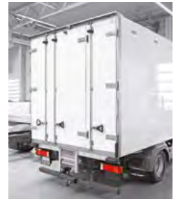
... mit 3-flügeliger Hecktür.