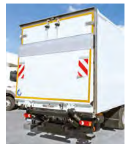
... mit Flügeltüren und LBW.