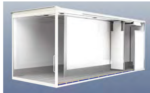
Die eigene Konstruktion ermöglicht individuelle Lösungen.