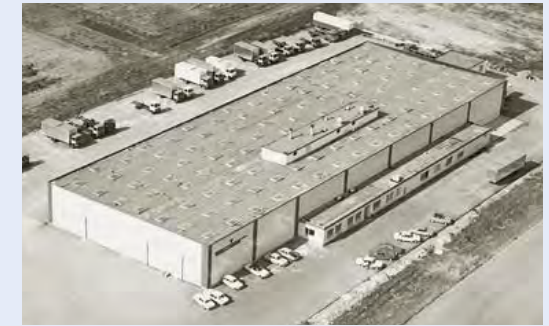
Die Produktionsanlagen der 1970er Jahre nach dem Umzug in das nahegelegene Gewerbegebiet der Stadt Steinheim.