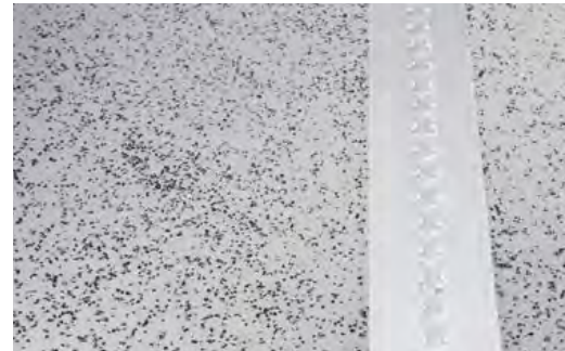
Bodenvariante Gießboden. Eingelassene Zurrschienen für vertikale Ladungssicherung sind möglich.