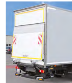
... mit LBW und Stellklappe.