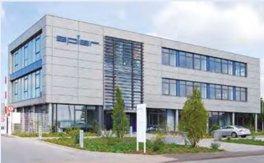
Wie die Spier-Produkte steht auch die moderne Verwaltung für Effizienz, klare Formensprache und unaufdringliche Wertigkeit.