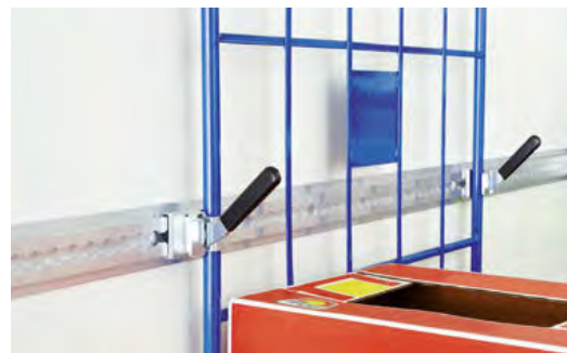
Transport von Rollcontainern gesichert mit Spannhebeln an den Seitenwandschienen.