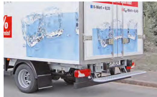
Federnder Hecktritt als Einstieg. Die spezielle Ausführung dient zusätzlich als Rammschutz und verhindert Schäden am Fahrzeug.