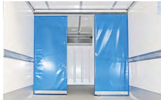
Kälteschutzvorhang als Isolier-Plattenvorhang.