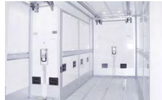
Längs- und Quertrennwände. Für unterschiedliche Temperaturzonen kombiniert montierbar.