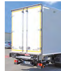
... mit unterfaltbarer LBW.