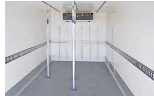
Horizontale und vertikale Ladungssicherung kombinierbar. Luftzirkulationsprofile an der Vorderwand.