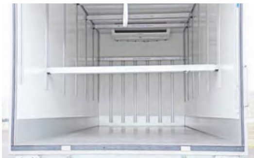
Doppelstockbeladungseinrichtung zur optimalen Nutzung des Laderaums.