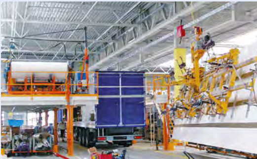
Handwerkliches Know-how, optimierte Arbeitsprozesse sowie moderne Produktionsanlagen kennzeichnen unser Werk heute.