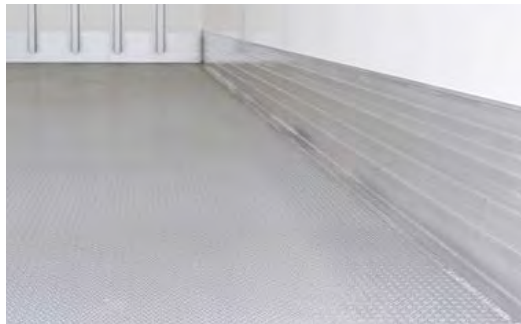
Bodenvariante Aluminium-Gerstenkorbboden. Umlaufende Verschweißung mit der Scheuerleiste ist möglich.