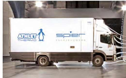
Der ATHLET Thermo im Windkanal. Ausgefeilte Aerodynamik sorgt für geringeren Kraftstoffverbrauch und weniger CO 2 -Emissionen.