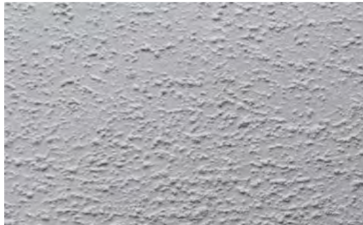
Bodenvariante Gripstar. Verschleiß- und rutschfeste Kunststoffbeschichtung mit feiner Körnung.