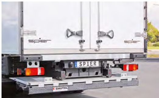
Heckrahmen bestehend aus V4A-Edelstahl und stabiler Unterbau mit auf dem Montagerahmen wirkenden Heckstoßgummis.