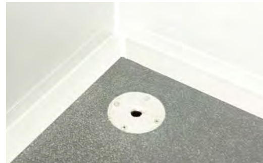
Bodenabfluss in verschiedenen Ausführungen erhältlich.