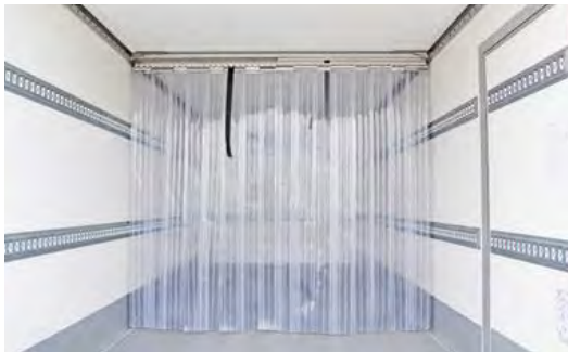
Kälteschutzvorhang reduziert den Kälteverlust. Ein- oder mehrteilig, in fest oder verschiebbaren Varianten lieferbar.