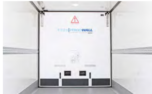
Quertrennwand. Fest oder verschiebbar verbaut.