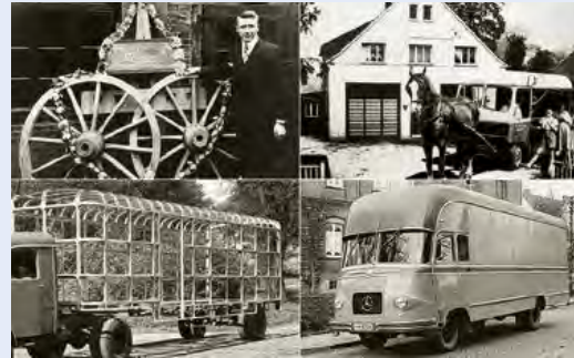
Im Handwerk verwurzelt: Von der Stellmacherei in 1872 zum modernen Hersteller von Aluminium-Möbeltransportern der 1950er Jahre.