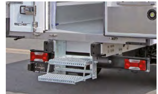
Mehrstufige Klapptreppe am Heck für den ergonomischen Einstieg in den Laderaum.