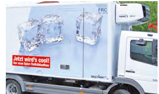
Seitentür mit innenliegenden Dichtungen ermöglicht eine optimale Werbewirkung.