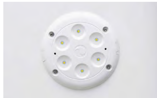
Die serienmäßige LED-Innenbeleuchtung sorgt für einen hellen Laderaum.