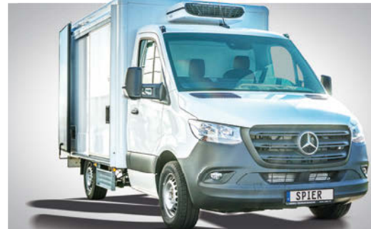
In der Konstruktions- und Entwicklungsabteilung werden eigene Lösungen entworfen: Hier zum Beispiel ein maßgeschneidertes Home Delivery-Fahrzeugkonzept.