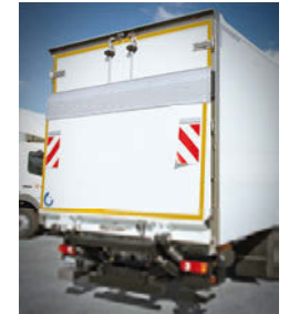
... mit Flügeltüren und LBW