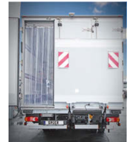
... mit 2/3 LBW