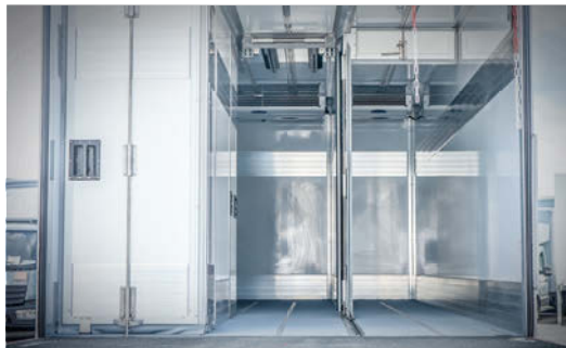
Längs- und Quertrennwände – für unterschiedliche Temperaturzonen kombiniert montierbar.