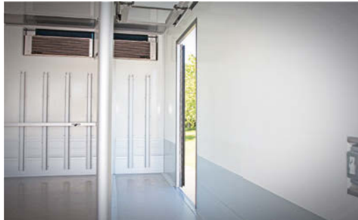
Die umlaufende Scheuerleiste schützt die Ware vor Beschädigungen.