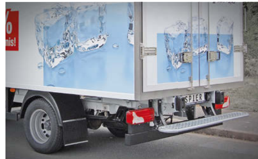
Federnder Hecktritt als ergonomischer Einstieg und Rammschutz am Heck