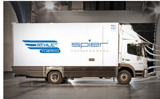
Der Athlet Thermo im Windkanal - ausgefeilte Aerodynamik sorgt für geringeren Kraftstoffverbrauch und weniger CO 2 -Emissionen.