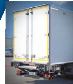
... mit unterfaltbarer LBW