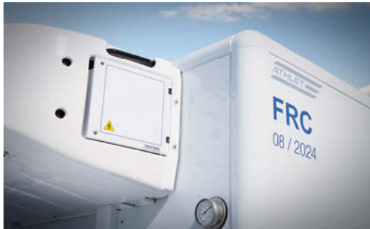
Serienmäßige Ausstattung des Athlet Thermo-Aufbaus mit dem aeroform Profil