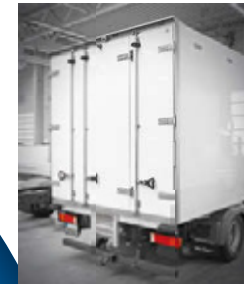
... mit 3-flügeliger Hecktür